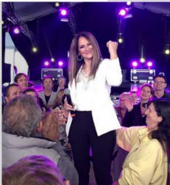
Le sosie de Céline Dion avait fait le déplacement depuis Perpignan.